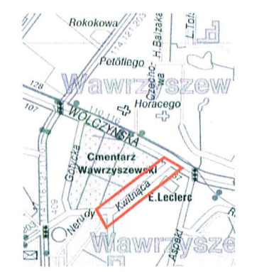
PLAN ORIENTACYJNY SKALA 1 : 20 000

URZĄD MIASTA STOŁECZNEGO WARSZAWY BIURO POLITYKI MOBILNOŚCI I TRANSPORTU ul. Marszałkowska 77/79, 00-683 Warszawa ZATWIERDZENIE Nr: PM/IC/4000/18 ZATWIERDZAM do realizacji w terminie do dnia 29.10.2018 r. projekt czasowej organizacji ruchu w całości - w całości - bez zmian - z zmianami wniesionymi w projekcie kolorem czerwonym wraz z załącznikami z programem sygnalizacji nr 15/ Zatwierdzenie dotyczy terenu położonego w liniach rozgraniczających dróg publicznych. Wprowadzenia zatwierdzonej czasowej organizacji ruchu można dokonać po uzyskaniu zezwolenia z zarządu drogi na zajęcie terenu i zawiadomieniu organu zarządzającego ruchem o terminie jej wprowadzenia, co najmniej 7 dni przed dniem wprowadzenia organizacji ruchu. O przywróceniu stałej organizacji ruchu należy niezwłocznie powiadomić zarządzającego ruchem. Znaki B-36 ustawić minimum 2018-09-24 5 dni przed terminem ich obowiązywania. Kłopoty o handlu rozprowadzić wypisanie cel strony chodnika z up. PREZYDENTA M. ST. WARSZAWY 10 WRZ. 2018 z up. PREZYDENTA M. ST. WARSZAWY Paweł Nowak Inspektor w Wydziale Infrastruktury dla Dzielnicy Bielany